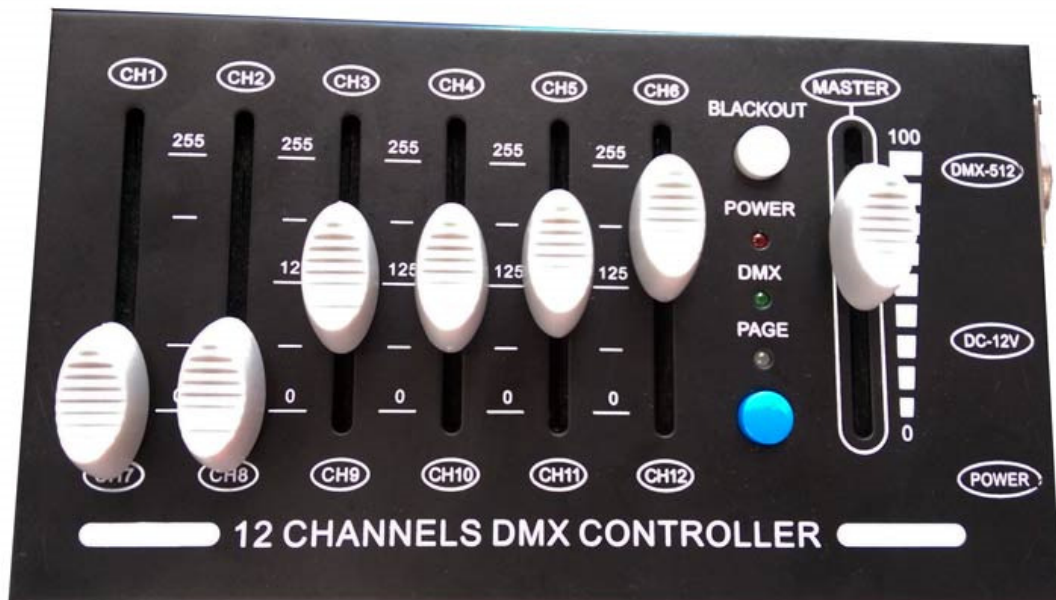
DMX Steuerpult C-12