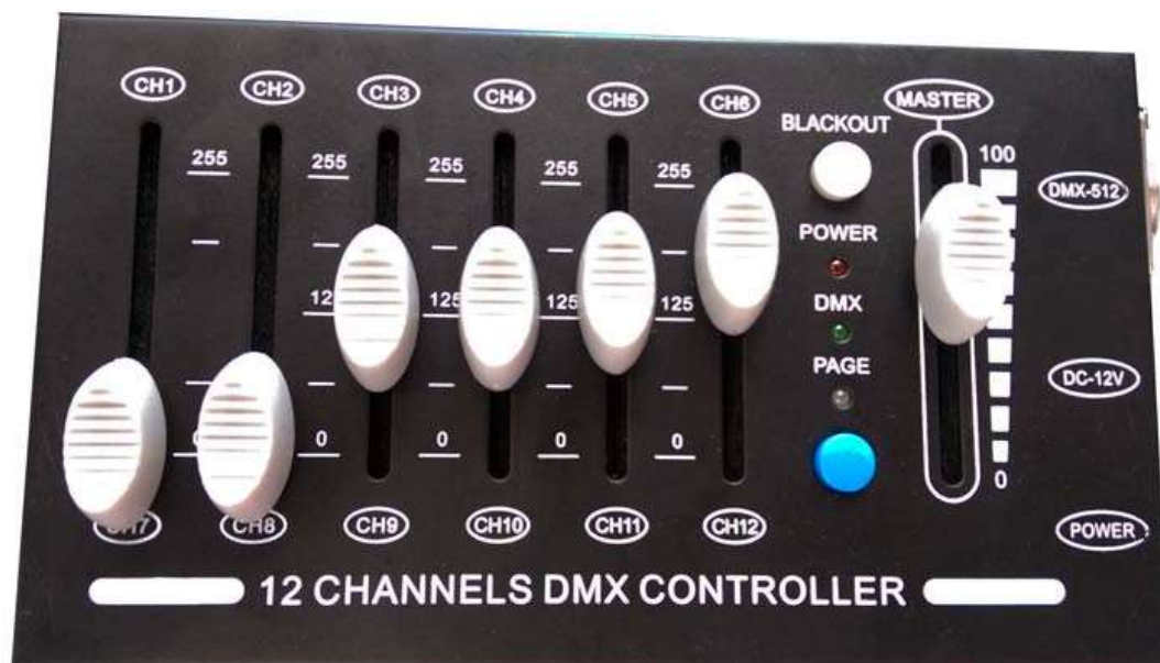
DMX Steuerpult C-12